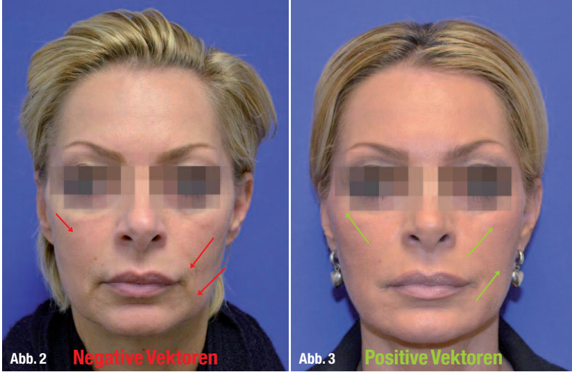
Abb. 2: Negative Vektoren, die im Laufe des Alterungsprozesses entstehen.